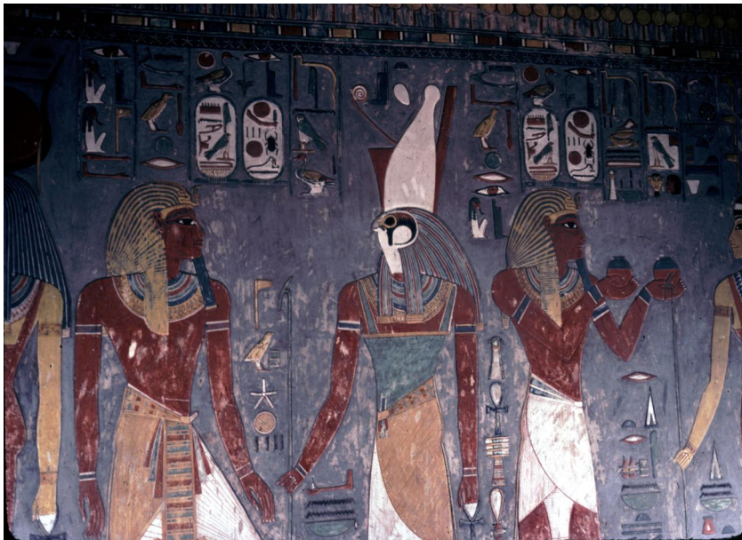
Fig. 2. Tomba di Haremhab nella Valle dei Re.

le cui pitture sono state trasferite nel 1906 a Torino da Deir el-Medina per iniziativa di Ernesto Schiaparelli, ma si osserva egualmente nelle illustrazioni dipinte di magnifici esemplari di Libro dei Morti, che sono conservati (recentemente ricostruiti da frammenti) nel Museo Egizio di Torino, qui pervenuti nel 1823 con la prima collezione procurata da Bernardino Drovetti. Del resto non lontano dal dirupo in cui fu scavata la serie di tombe rupestri inglobate dal Bubasteion si trova la tomba sontuosa che si fece preparare Haremhab quando era solo generale dell'esercito, prima che, divenuto faraone, si facesse approntare una nuova sepoltura adeguata a un dio nella Valle dei Re a Tebe. Alcuni dei rilievi più belli, incisi su lastre di calcare appoggiate alle murature in mattoni crudi, sono ora vanto della sezione egizia del Museo archeologico di Bologna. La tomba fu infine usata per due consorti del generale divenuto faraone [Fig. 2].