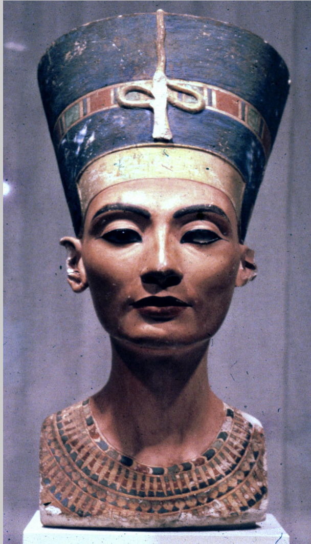
Fig. 3. Ritratto di Nefertiti.